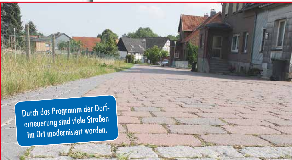
Durch das Programm der Dorferneuerung sind viele Straßen im Ort modernisiert worden.