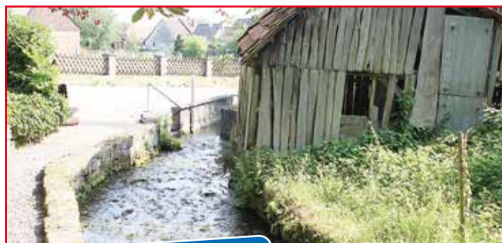
Symbol und Namensgeber des Ortes: die Quelle der Hamel